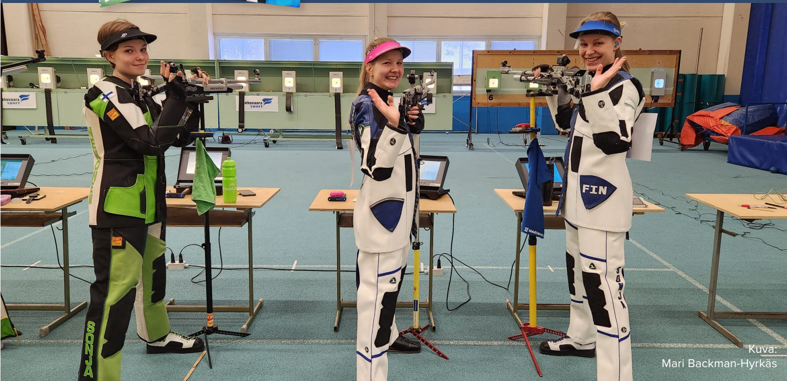
Kuva: Mari Backman-Hyrkäs